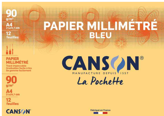
Millimeterpapier DIN A4, blau