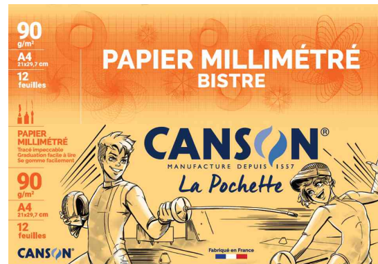
Millimeterpapier DIN A4, dunkelbraun