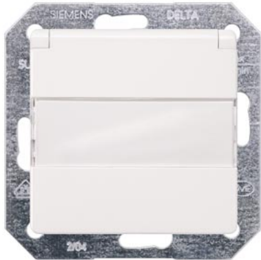
DELTA i-system titanweiß SCHUKO mit Klappdeckel, Kinderschutz,Schriftfeld 55x55mm 10/16A 250V