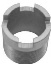
Druckmutter (MAN / Mercedes)