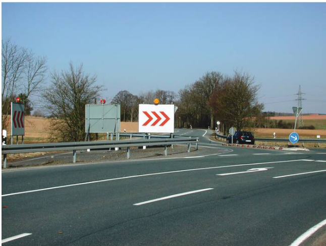
Anwendungsbeispiel: im Straßenverkehr eingesetzt