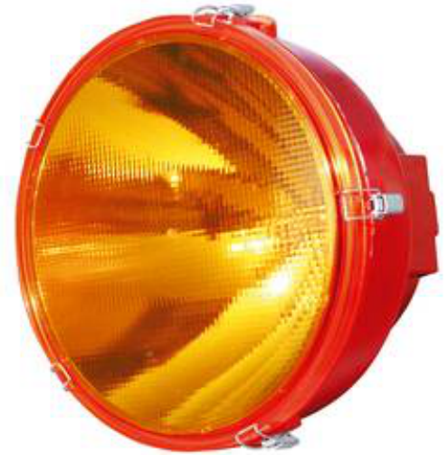
Modellbeispiel: MS 340 Vorwarner, Ø 340 mm mit Nachtablenkung (Art. 18728)