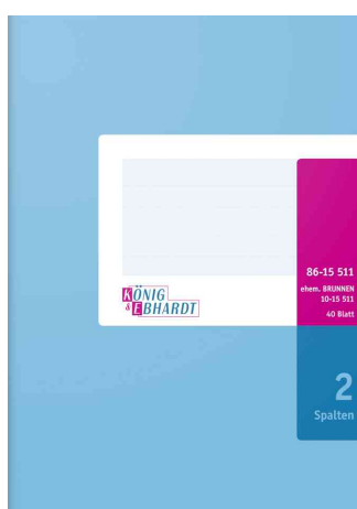
Livres à colonnes format A5