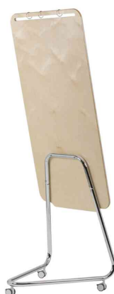
Vue détaillée : Dos en contreplaqué de bouleau