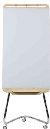
Tableau en verre "Douro"