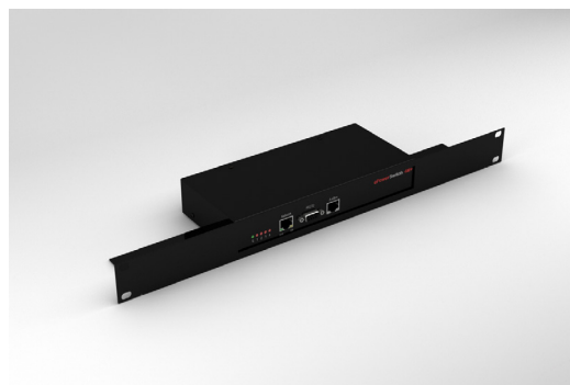
ePowerSwitch 4M+ mit optionalen 19"-Rackmount