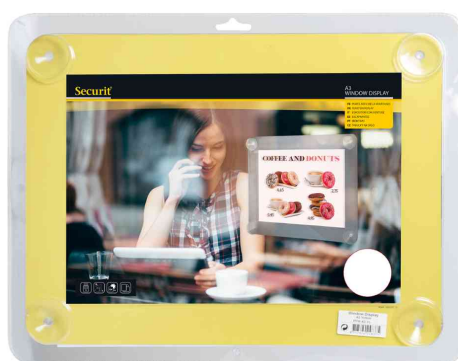
Porte-affiches A4, jaune