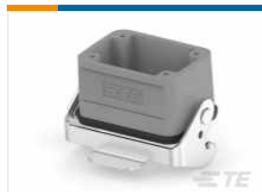
TE Teilnr.:T1730060000-000 H6B-TBF-T