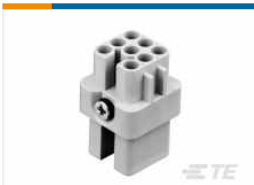
TE Teilnr.:T2020082201-000 HD-008-F