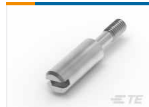
TE Teilnr.:T0931003003-000 CODING-PIN-M3