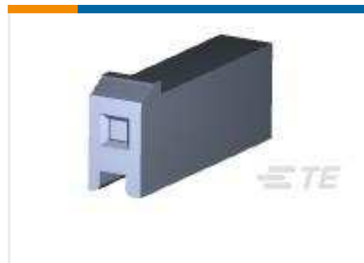
TE Teilnr.:640250-1 01P SL156 HSG W/LCK RAMP NATL