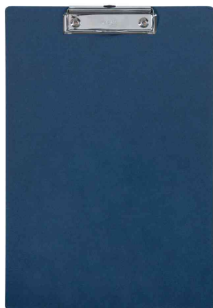
Porte-bloc à pince MAULbalance, bleu