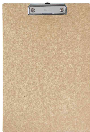
Porte-bloc à pince MAULbalance, brun