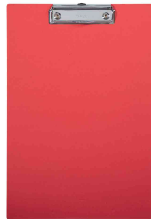
Porte-bloc à pince MAULbalance, rouge