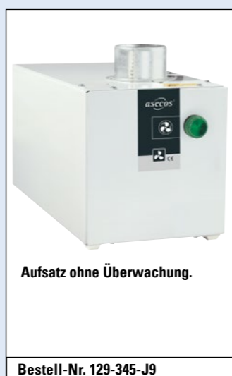
Aufsatz ohne Überwachung.