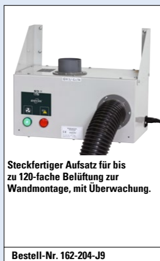
Steckfertiger Aufsatz für bis zu 120-fache Belüftung zur Wandmontage, mit Überwachung.