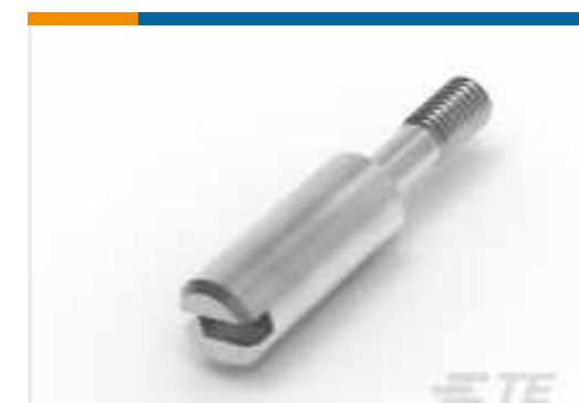
TE Teilnr.:T0931003003-000 CODING-PIN-M3