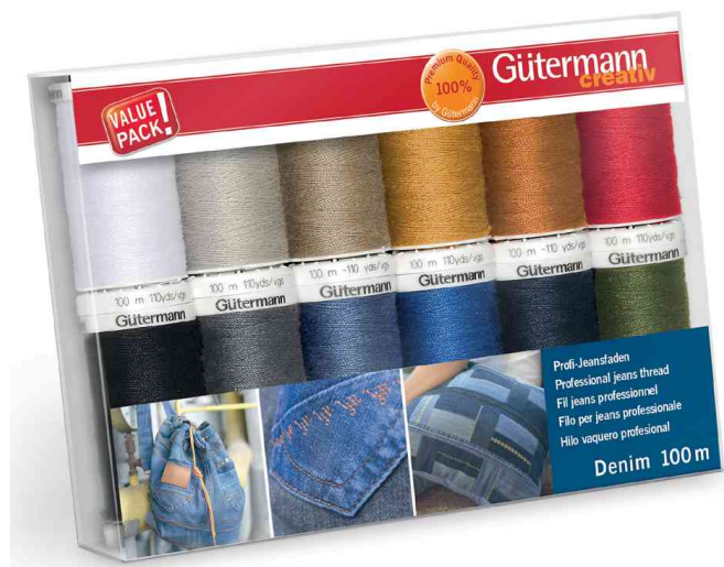
Set de fils à coudre "Denim", 12 bobines