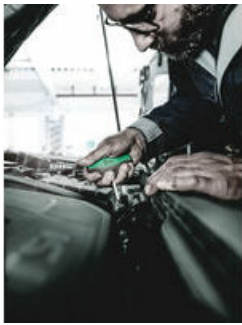
Schraubendreher mit Quergriff