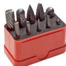
Typ FS SET 10 B