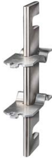
NH-TRENNMESSER GR.4 1000A