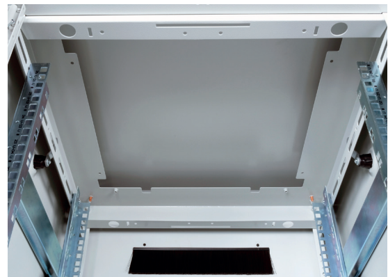
Dach mit Ausstanzungen für Belüftung