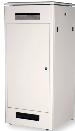
Rückwand mit Kabelzuführung