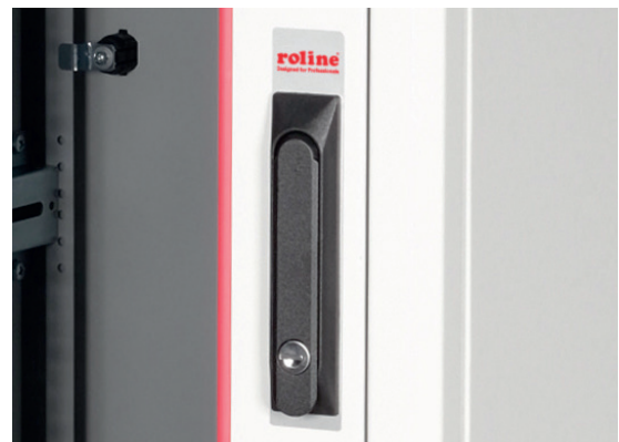
Verschluss-System mit Schwenkhebelgriff