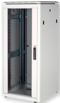
Fronttür aus gehärtetem Glas