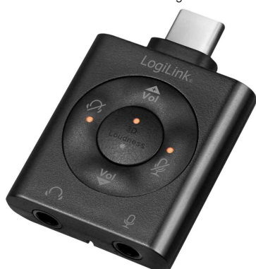
USB-C - Audio-Adapter mit EQ, virtuell 7.1