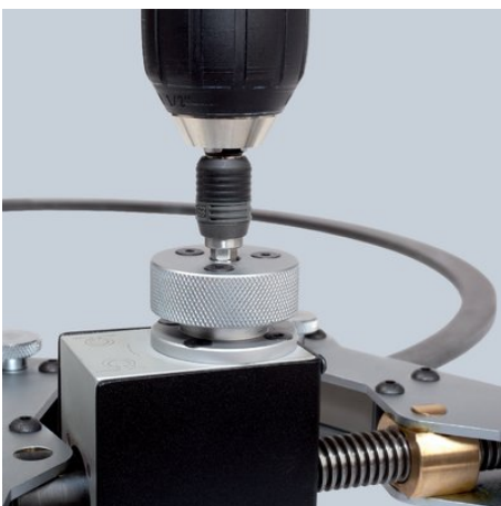
!Maschinell oder von Hand zu betätigen!

A műszaki változtatások és tévedések jogát fenntartjuk