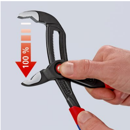
Premere il pulsante - aprire completamente la pinza