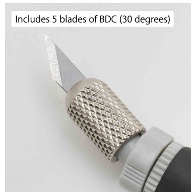
Visuel de référence : vue détaillée de la lame

Rotating the blade 360 degree to cut smooth curve.