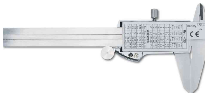
Pied à coulisse de précision digital, arrière