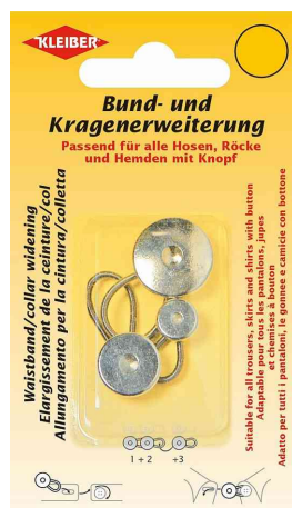
Extenseur de ceinture et de col