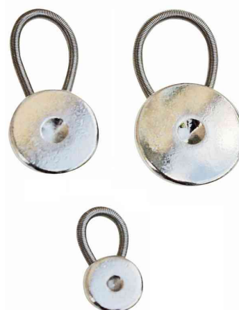
Extenseur de ceinture et de col, différents diamètres