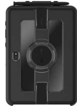
Schwarz/Clear 77-64126 840104201473