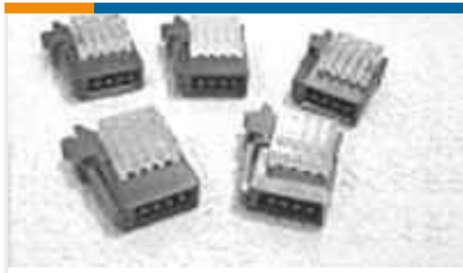
TE Teilenummer4-1473562-4 RITS CONN. PLUG ASSY 4P GREEN