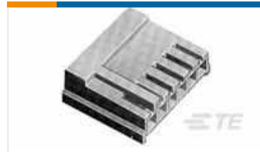
TE Teilenummer1-171822-2 EIS REC. HSG 12P-NATURAL