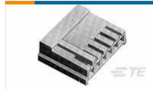
TE Teilenummer171822-6 EIS REC. HSG 6P-NATURAL