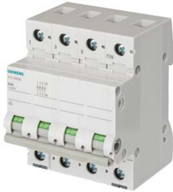
Ausschalter 100A 3-polig+N