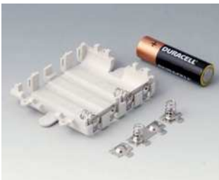
A9345217 Batteriefach-Set, 4 x AA ABS (UL 94 HB) grauweiß RAL 9002