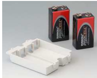
A9174002 Batteriefach, 2 x 9 V ABS (UL 94 HB) grauweiß RAL 9002