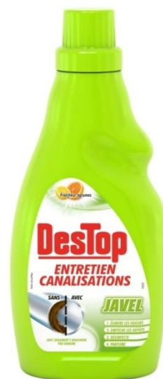
Javel 4en1 citron pamplemousse 750ml