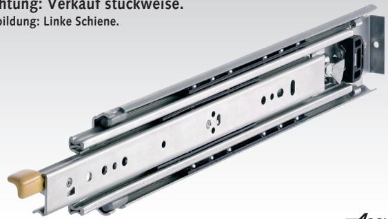
Abbildung: Linke Schiene.