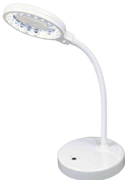
Mini lampe de bureau à LED avec loupe