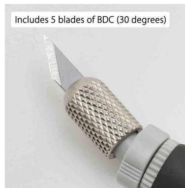
Includes 5 blades of BDC (30 degrees)