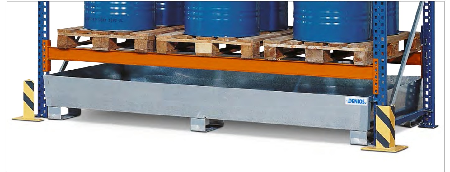
Verzinkte Regalwannen zum Einschleiben unter vorhandene Regalsysteme, lieferbar in 6 Abmessungen, optional auch mit PE-Einlegewannen und Gitterrosten als Stellebenen.