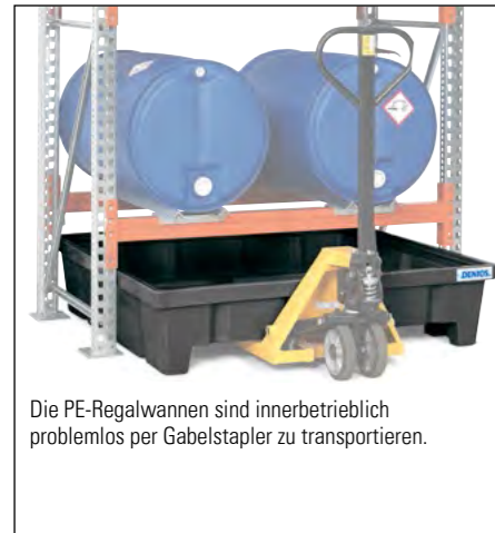
Die PE-Regalwannen sind innerbetrieblich problemlos per Gabelstapler zu transportieren.