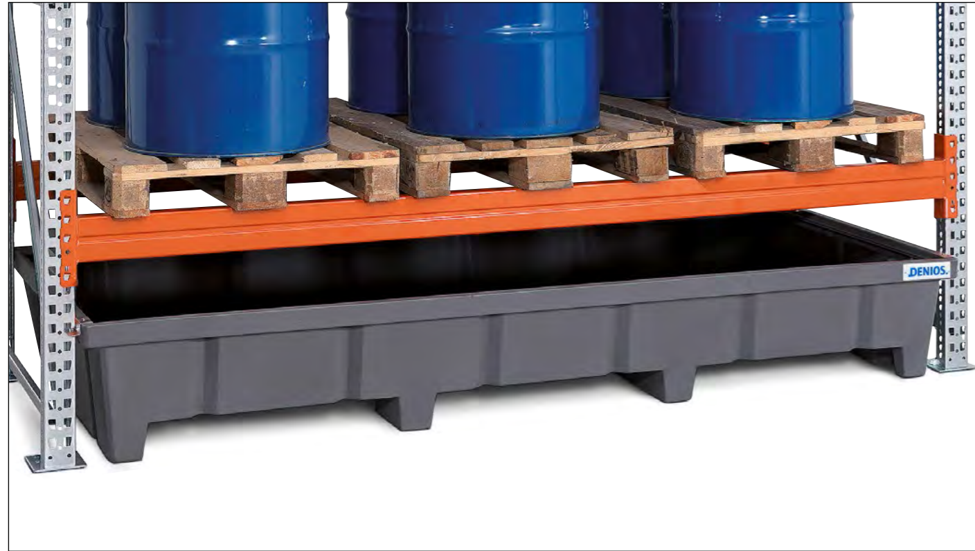
Regalwannen aus Polyethylen (PE) zum Einschleiben unter vorhandene Regalsysteme, lieferbar in 5 Abmessungen.