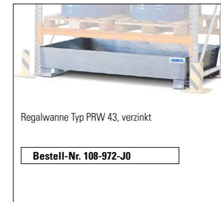
Regalwanne Typ PRW 43, verzinkt