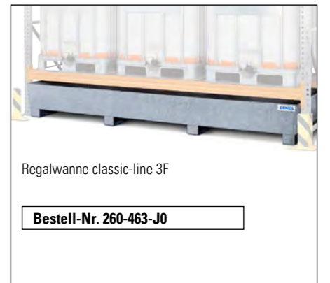
Regalwanne classic-line 3F