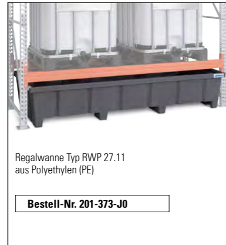
Regalwanne Typ RWP 27.11 aus Polyethylen (PE)