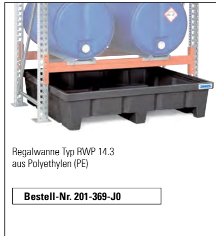
Regalwanne Typ RWP 14.3 aus Polyethylen (PE)