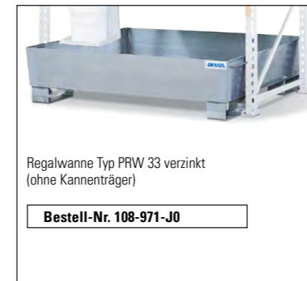
Regalwanne Typ PRW 33 verzinkt (ohne Kannenträger)