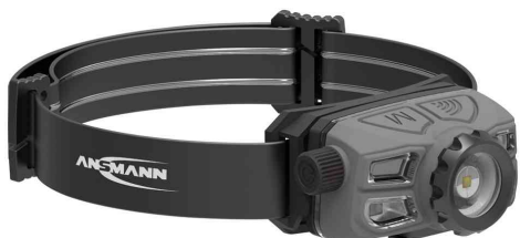
Lampe frontale LED à capteur HD450FRS