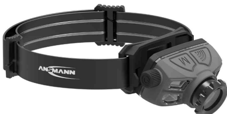
Lampe frontale LED à capteur HD450FRS