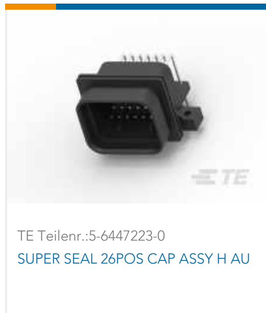
TE Teilnr.:5-6447223-0 SUPER SEAL 26POS CAP ASSY H AU