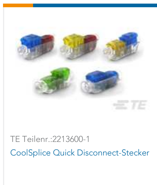
TE Teilnr.:2213600-1 CoolSplice Quick Disconnect-Stecker