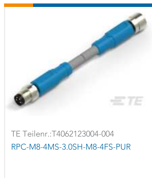
TE Teilnr.:T4062123004-004 RPC-M8-4MS-3.0SH-M8-4FS-PUR