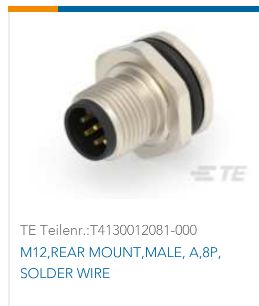
TE Teilnr.:T4130012081-000 M12,REAR MOUNT,MALE, A,8P, SOLDER WIRE