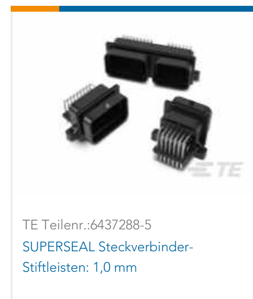
TE Teilnr.:6437288-5 SUPERSEAL Steckverbinder- Stiftleisten: 1,0 mm