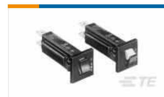
TE Teilnr.:1-1393250-7 W28-XQAT-15=W28