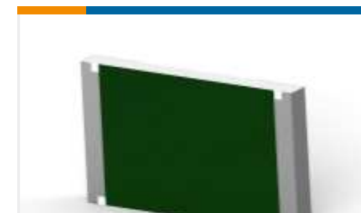
TE Teilnr.:8-2176407-8 3560 27R 5%