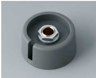
A3031068 COM-KNOBS 31, mit Aussparung PA 6 vulkan 31x16mm 6mm