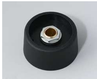
A3131069 COM-KNOBS 31, ohne Aussparung PA 6 nero 31x16mm 6mm