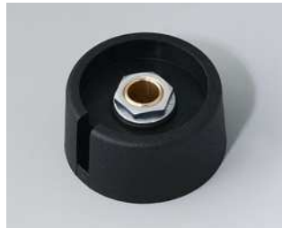
A3031069 COM-KNOBS 31, mit Aussparung PA 6 nero 31x16mm 6mm