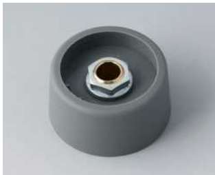
A3131068 COM-KNOBS 31, ohne Aussparung PA 6 vulkan 31x16mm 6mm