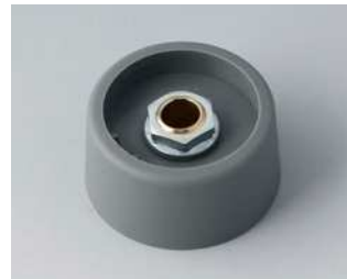
A3131638 COM-KNOBS 31, ohne Aussparung PA 6 vulkan 31x16mm 1/4"