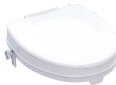
Toilettensitzerhöhung | 5 cm mit Deckel Sitzmaße (B x T): 35,5 x 40 cm Max. Belastbarkeit: 225 kg Artikel-Nr. 952824