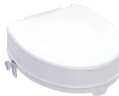
Toilettensitzerhöhung | 10 cm mit Deckel Sitzmaße (B x T): 35,5 x 40 cm Max. Belastbarkeit: 225 kg Artikel-Nr. 952826