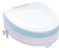
Toilettensitzerhöhung | 10cm mit Sitzauflage und Deckel Sitzmaße (B x T): 35,5 x 40 cm Max. Belastung 225 kg Artikel-Nr. 952837