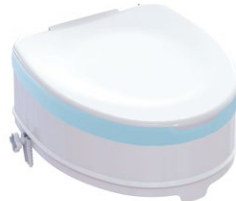
Toilettensitzerhöhung | 15cm mit Sitzauflage und Deckel Sitzmaße (B x T): 35,5 x 40 cm Max. Belastung 225 kg Artikel-Nr. 952843