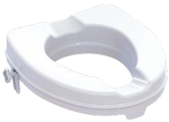
Toilettensitzerhöhung | 5 cm Sitzmaße (B x T): 35,5 x 40 cm Max. Belastbarkeit: 225 kg Artikel-Nr. 952823

Wichtige Zentimeter: Eine Sitzerrhöhung kann den entscheidenden Unterschied für den selbstständigen Toilettengang machen. Schnell montiert, rutschfest und bequem – aber vor allem unschätzbar für die Würde.