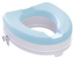
Toilettensitzerhöhung | 10 cm mit Sitzauflage Sitzmaße (B x T): 35,5 x 40 cm Max. Belastbarkeit: 225 kg Artikel-Nr. 952847