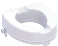
Toilettensitzerhöhung | 10 cm Sitzmaße (B x T): 35,5 x 40 cm Max. Belastbarkeit: 225 kg Artikel-Nr. 952825