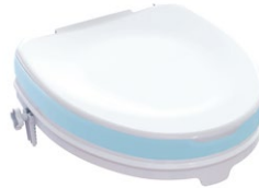
Toilettensitzerhöhung | 5 cm mit Sitzauflage und Deckel Sitzmaße (B x T): 35,5 x 40 cm Max. Belastung 225 kg Artikel-Nr. 952839