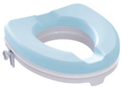
Toilettensitzerhöhung | 5 cm mit Sitzauflage Sitzmaße (B x T): 35,5 x 40 cm Max. Belastbarkeit: 225 kg Artikel-Nr. 952838