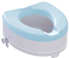
Toilettensitzerhöhung | 15 cm mit Sitzauflage Sitzmaße (B x T): 35,5 x 40 cm Max. Belastbarkeit: 225 kg Artikel-Nr. 952851