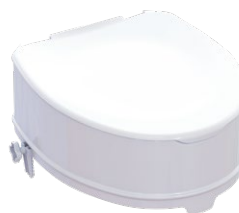
Toilettensitzerhöhung | 15 cm mit Deckel Sitzmaße (B x T): 35,5 x 40 cm Max. Belastbarkeit: 225 kg Artikel-Nr. 952828