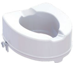
Toilettensitzerhöhung | 15 cm Sitzmaße (B x T): 35,5 x 40 cm Max. Belastbarkeit: 225 kg Artikel-Nr. 952827