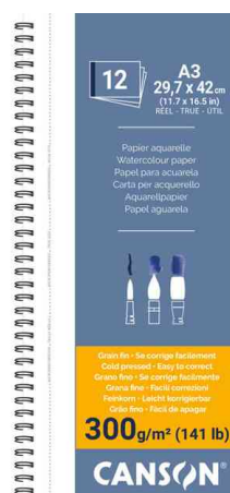
Visuel de référence: Album papier à dessin "Montval", reliure spirale