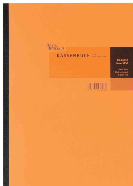
Kassenbuch DIN A4, Bruttoverbuchung