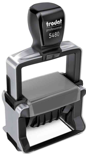
Datumstempel Professional 4.0 5480

Zubehör: Ersatzstempelkissen: Abgabe nur in ganzen VE's