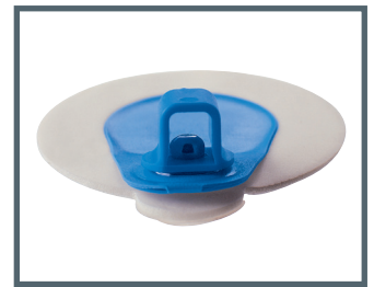
A = 4 mm Bananenstecker