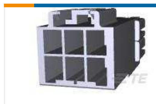
TE Teilenummer179466-1 AMP POWER DBL LOCK CAP HSG 6P