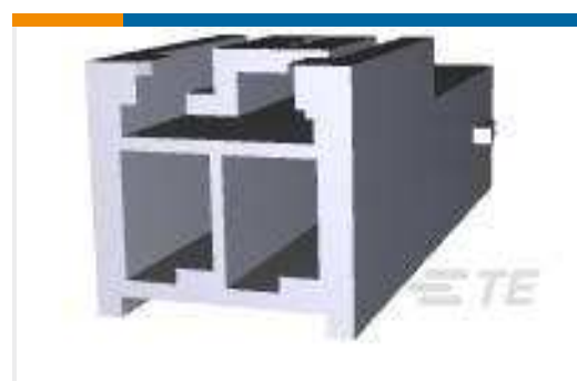
TE Teilenummer179463-1 POWER DBL LOCK CAP HSG F/H 3P