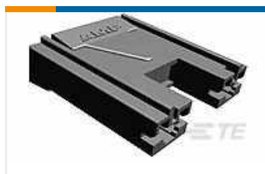
TE Teilenummer176498-1 POSITIVE LOCK 187 (4.8 MM) HOUSING