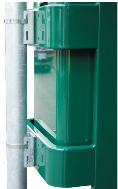
Detailansicht: Mastbefestigung mit Bandschelle