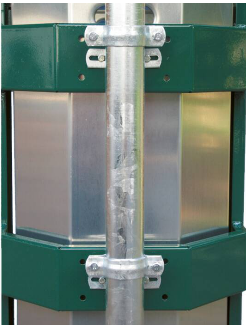
Detailansicht: Mastbefestigung mit Rohrschelle