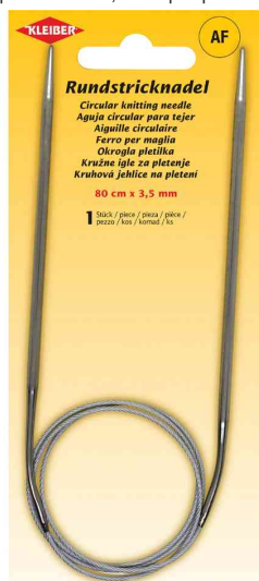
Aiguille à tricoter circulaire, 800 mm x 3,5 mm