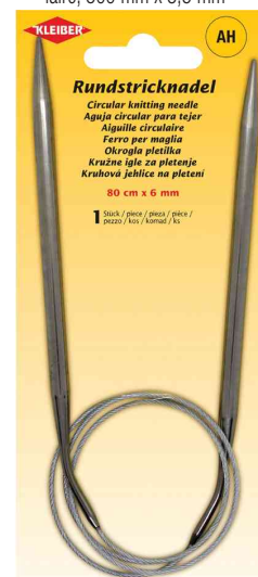
Aiguille à tricoter circulaire, 800 mm x 6,0 mm