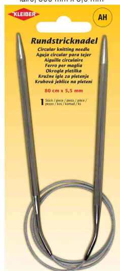
Aiguille à tricoter circulaire, 800 mm x 5,5 mm