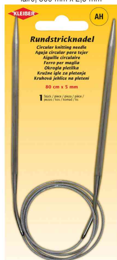
Aiguille à tricoter circulaire, 800 mm x 5,0 mm