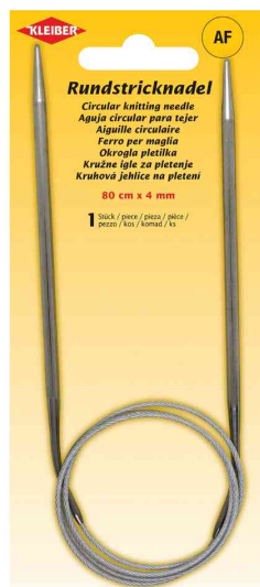
Aiguille à tricoter circulaire, 800 mm x 4,0 mm