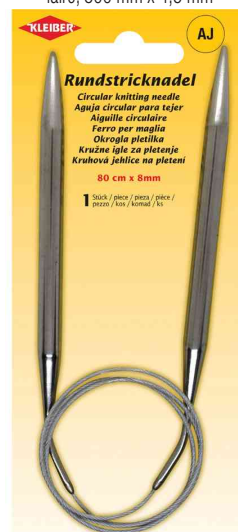
Aiguille à tricoter circulaire, 800 mm x 8,0 mm