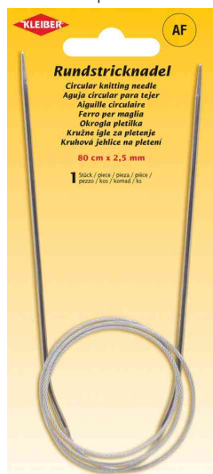
Aiguille à tricoter circulaire, 800 mm x 2,5 mm

- convient pour tricoter en rond et pour des ouvrages aec beaucoup de mailles, tels que pullovers, chaussettes ou bonnets