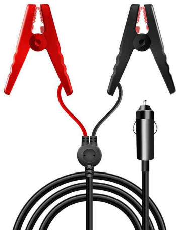
Câble adaptateur pour voiture

- pour l'alimentation électrique des réfrigérateurs de voiture, ventilateurs et autres appareils de 12 V avec connecteur DC7909