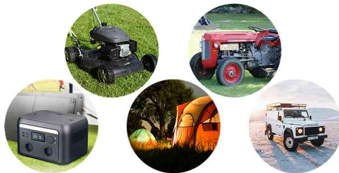
Visuel de référence: présente les domaines d'utilisation