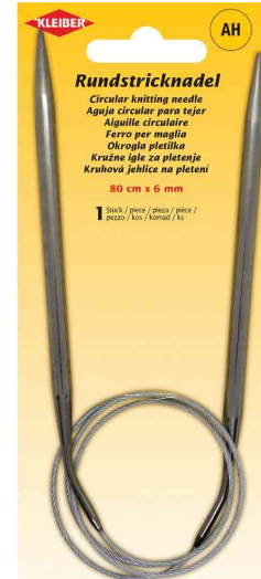
Rundstricknadel, 800 mm x 6,0 mm