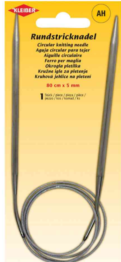
Rundstricknadel, 800 mm x 5,0 mm