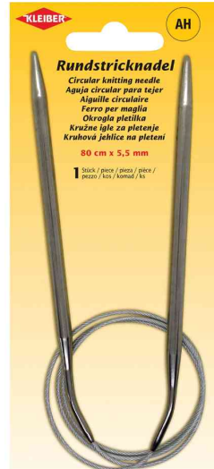
Rundstricknadel, 800 mm x 5,5 mm