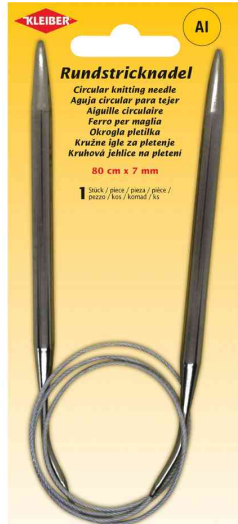
Rundstricknadel, 800 mm x 7,0 mm