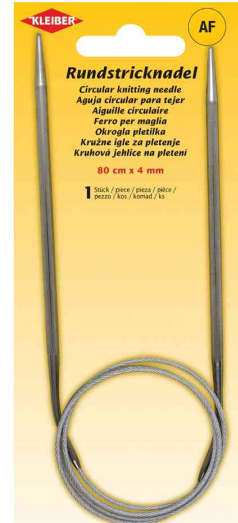
Rundstricknadel, 800 mm x 4,0 mm