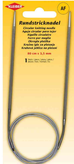
Rundstricknadel, 800 mm x 3,5 mm