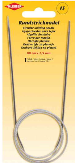
Rundstricknadel, 800 mm x 2,5 mm

- besonders für Rund- und Flächenstrickarbeiten geeignet wie z.B. Pullover, Socken oder Mützen