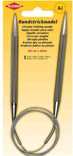
Rundstricknadel, 800 mm x 8,0 mm