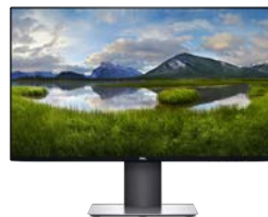
DELL ULTRASHARP 24-MONITOR | U2419H

Mit dem leistungsstarken Dell Thunderbolt Dock arbeiten Sie stets mit Höchstgeschwindigkeit. Über ein einziges Kabel können Sie Ihr System schneller laden, bis zu 3 4K-Displays unterstützen und Ihre Peripheriegeräte anschließen.