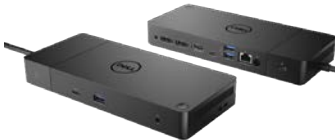
DELL THUNDERBOLT DOCK | WD19TB

Mit dem leistungsstarken Dell Thunderbolt Dock arbeiten Sie stets mit Höchstgeschwindigkeit. Über ein einziges Kabel können Sie Ihr System schneller laden, bis zu 3 4K-Displays unterstützen und Ihre Peripheriegeräte anschließen.