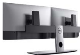
DELL STANDRAHMEN FÜR 2 MONITORE | MDS19

* (April 2019) Dell Thunderbolt Dock WD19TB wird mit Thunderbolt-kompatiblen Systemen verwendet. Dell Dock WD19 kann mit nicht-Thunderbolt-Systemen verwendet werden.