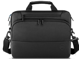
DELL PRO TASCHE 14/15 | PO1420C/PO1520C

Mit dem praktischen und kompakten 6-in-1-Adapter verbinden Sie Ihr Latitude mit nahezu jedem Gerät.