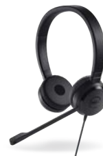
DELL PRO STEREO HEADSET | UC350

Dieser platzsparende Ständer ermöglicht die Montage von bis zu 2 27"-Monitoren und sorgt so für maximale Produktivität.