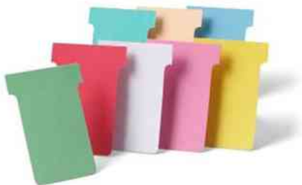
Visuel de référence: Fiches T