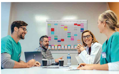
Visuel de référence: exemple d'utilisation