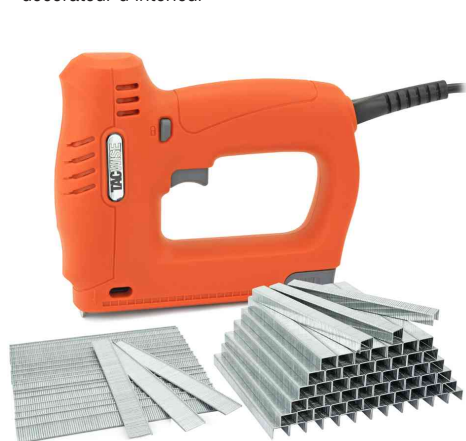
Pistolet agrafeur électrique à clous / agrafes 140EL, comprend des agrafes & des clous