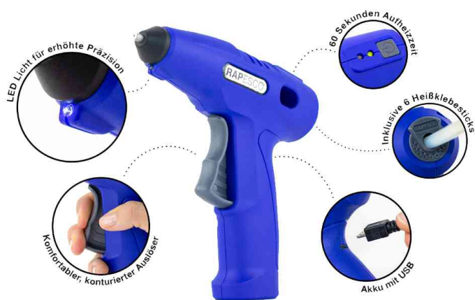
Pistolet à colle sans fil G4-7