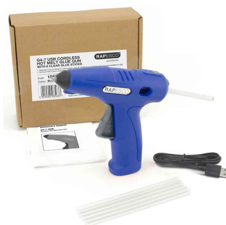
Contenu de la livraison: Pistolet à colle sans fil G4-7 + câble + bâtons de colle