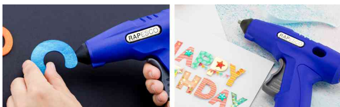
visuel de référence: exemple d'utilisation